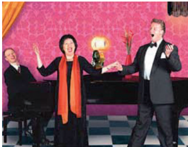
Flørt og fanteri - Opera Nordpå

Sangerne har alltid vært operaverdens store stjerner. I det 18. århundre tjente kastratsangere som Senesino og Farinelli enorme formuer og var berømte over hele Europa. Operasangere må både kunne synge og spille skuespill, men det finnes klare unntak fra reglene. Pavarotti har aldri vært berømt for sitt skuespillertalent, mens den største operadivaen noensinne, Maria Callas, fikk tilgivelse for mye teknisk rusk på grunn av hennes enorme tilstedeværelse og kraft på scenen.